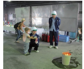
エアゾール式簡易消火具の操作体験 [日本消防検定協会]