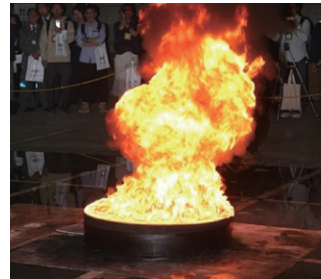
軽油の燃焼実験 [消防研究センター]

(1) JR中央線吉祥寺駅南口下車、「深大寺」「野ヶ谷」「調布駅北口」行きバス（6番乗り場）で「消防大学前」下車