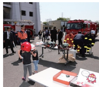
消防車両等の展示 [消防大学校]